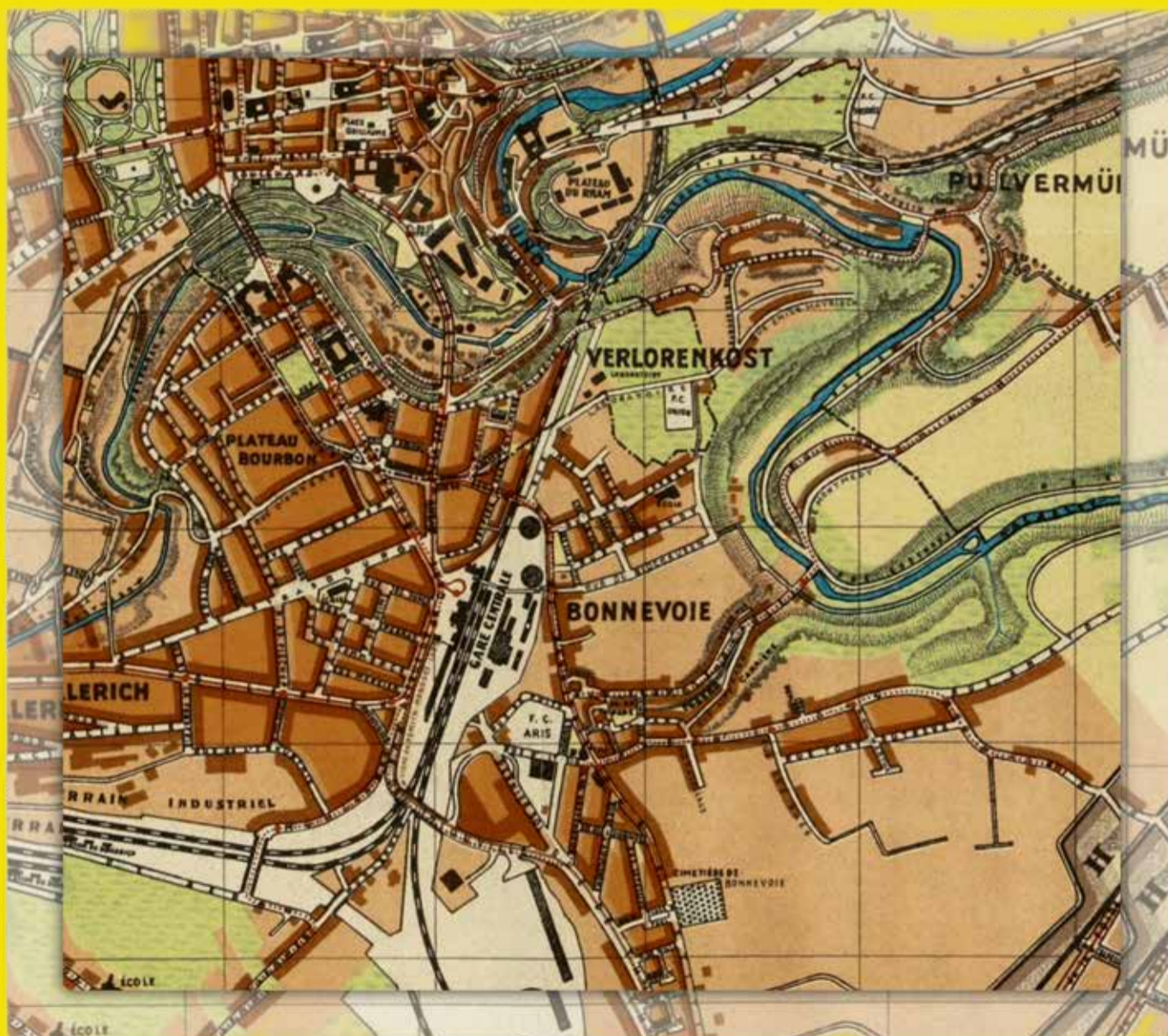
Bonneweg 1936, © Archives de la Ville de Luxembourg

11, rue Auguste Charles, Luxembourg-Bonnevoie